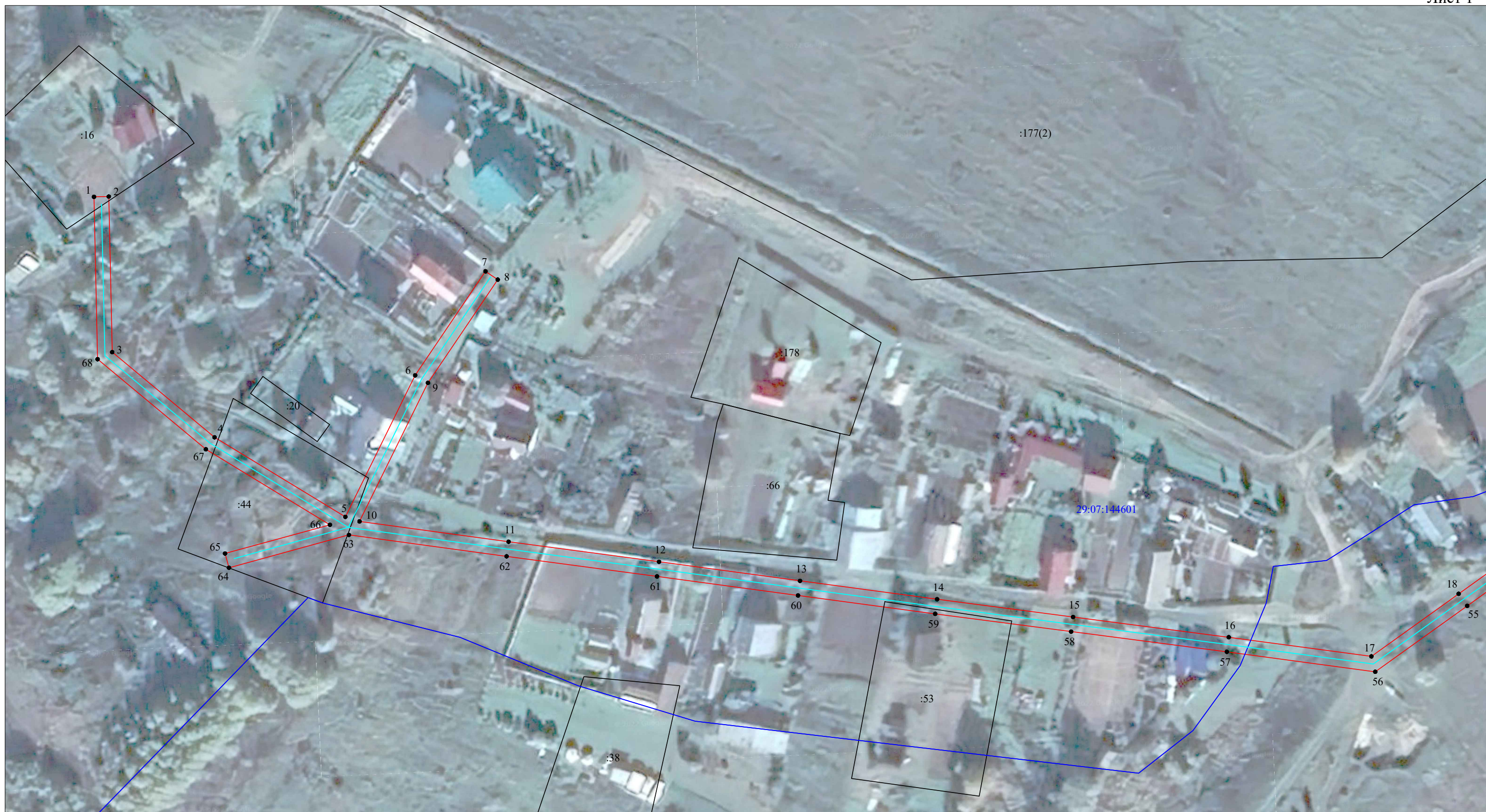
Схема расположения границ публичного сервитута объекта электросетевого хозяйства "ВЛ-0.4кВ ВЛ-10кВ Захарино"