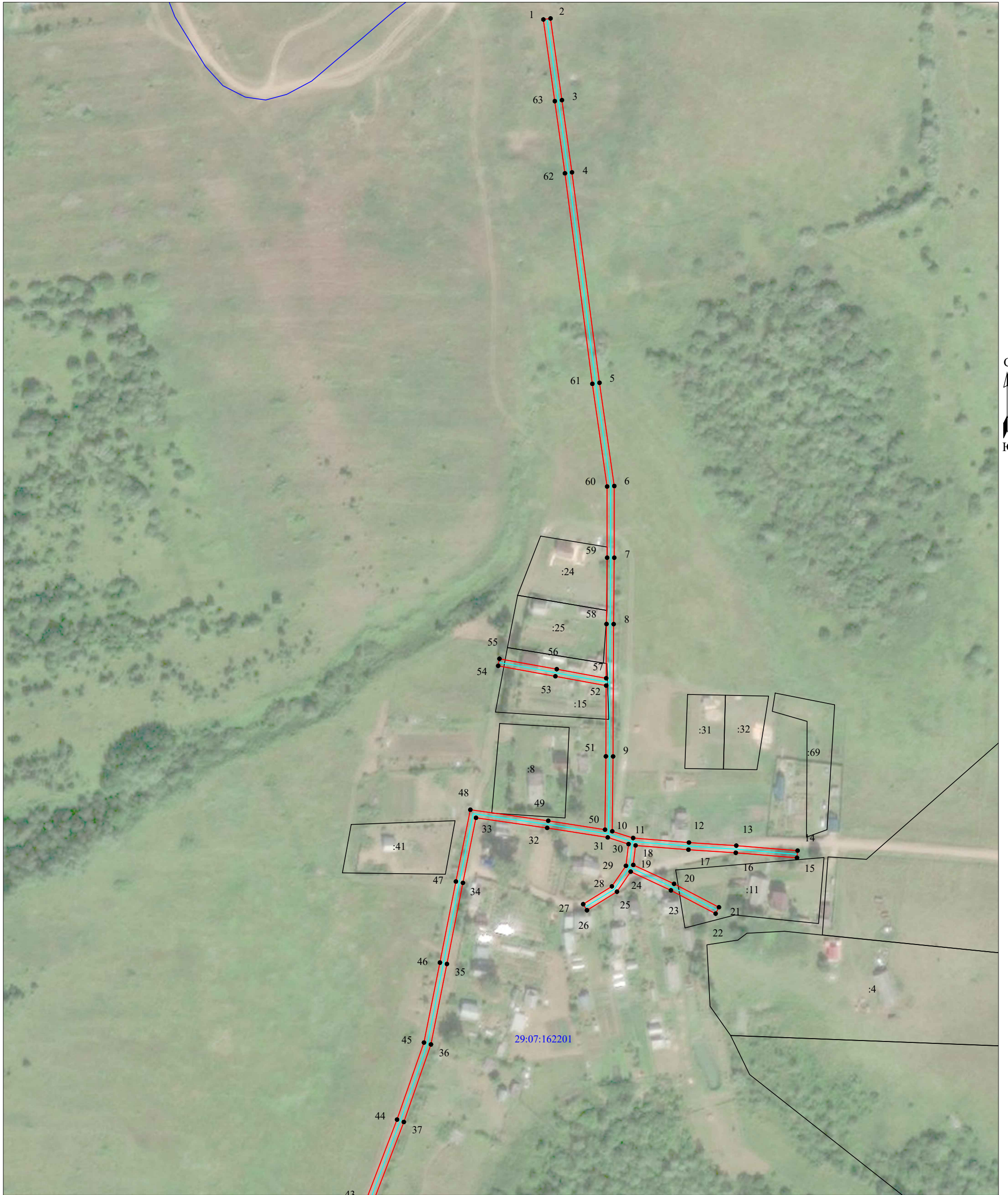
Схема расположения границ публичного сервитута объекта электросетевого хозяйства: «ВЛ-0,4кВ Песчанка», расположенного по адресу: Архангельская область, Котласский район