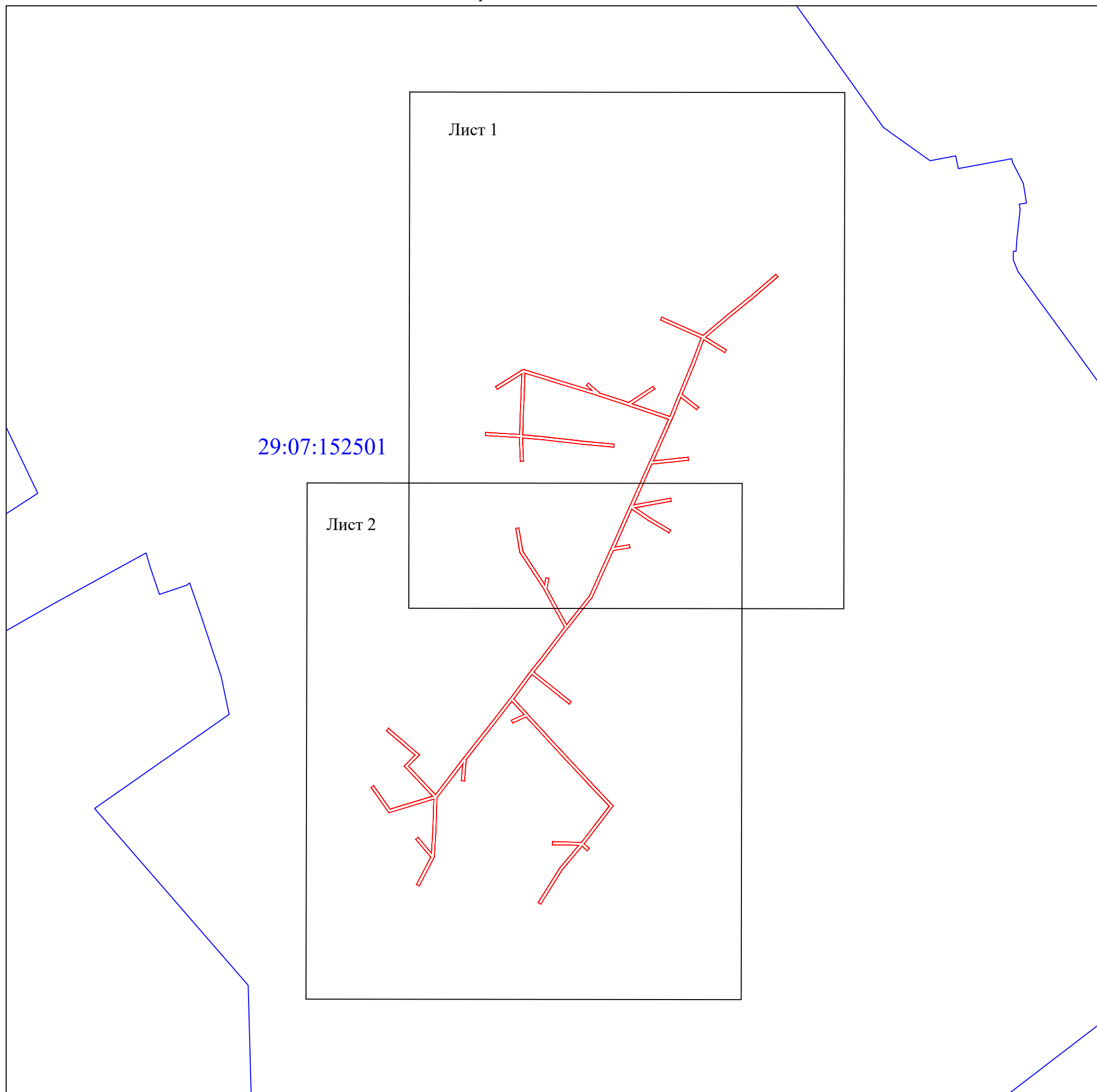
Схема расположения выносных листов

Кадастровые номера земельных участков, в отношении которых испрашивается публичный сервитут: 29:07:152501:48, 29:07:152501:194, 29:07:152501:206, 29:07:152501:398, 29:07:152501:487, 29:07:152501:490, 29:07:152501:494, 29:07:152501:496, 29:07:152501:1654, 29:07:152501:1665, 29:07:152501:1671, 29:07:152501:1672, земли кадастрового квартала: 29:07:152501