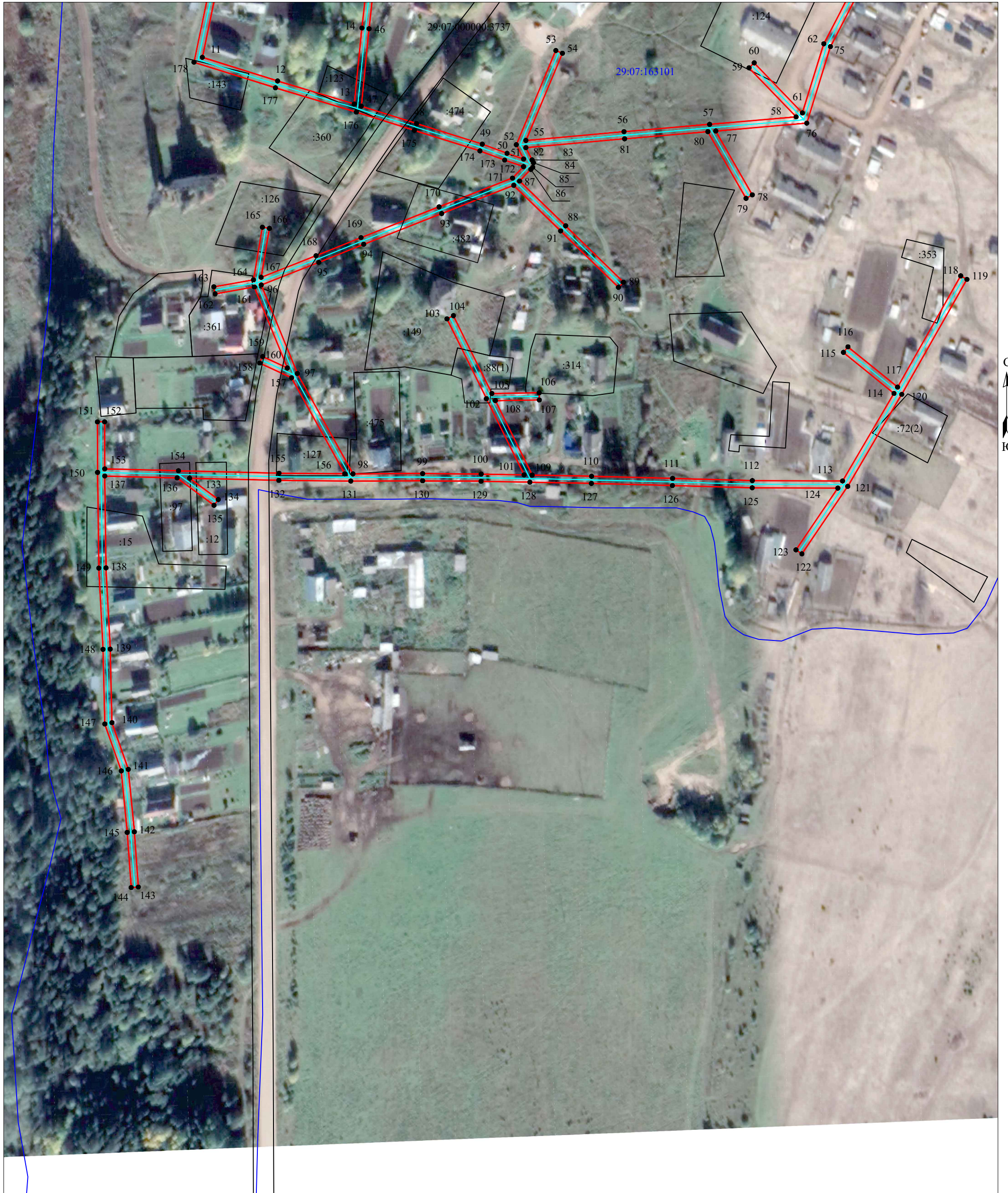
Схема расположения границ публичного сервитута объекта электросетевого хозяйства: «ВЛ-0.4кВ Выставка», расположенного по адресу: Архангельская область, Котласский район