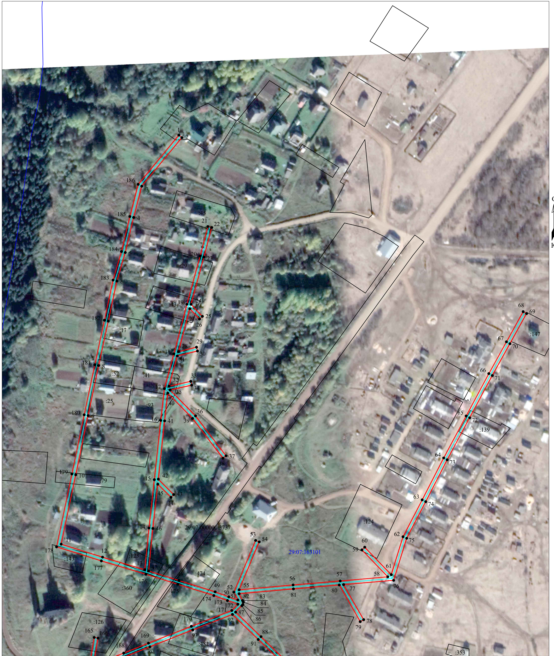
Схема расположения границ публичного сервитута объекта электросетевого хозяйства: «ВЛ-0.4кВ Выставка», расположенного по адресу: Архангельская область, Котласский район