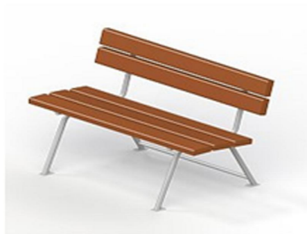
Садово-парковый диван на металлических ножках

Площадь асфальтирования тротуаров 117,67 кв.м