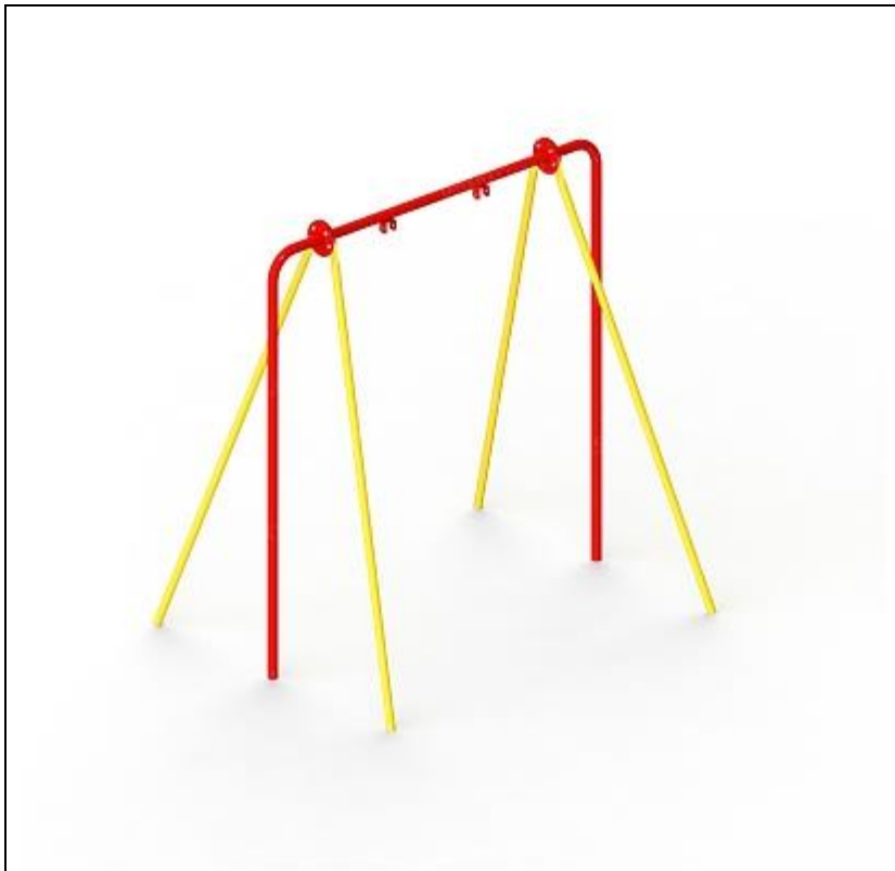
Сушилка для белья