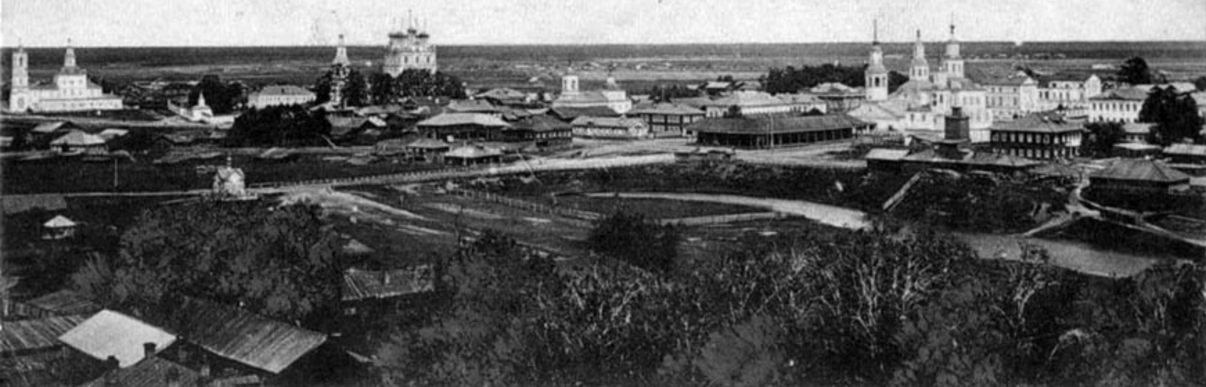
Г. Сольвычегодскъ. Общій Видъ.