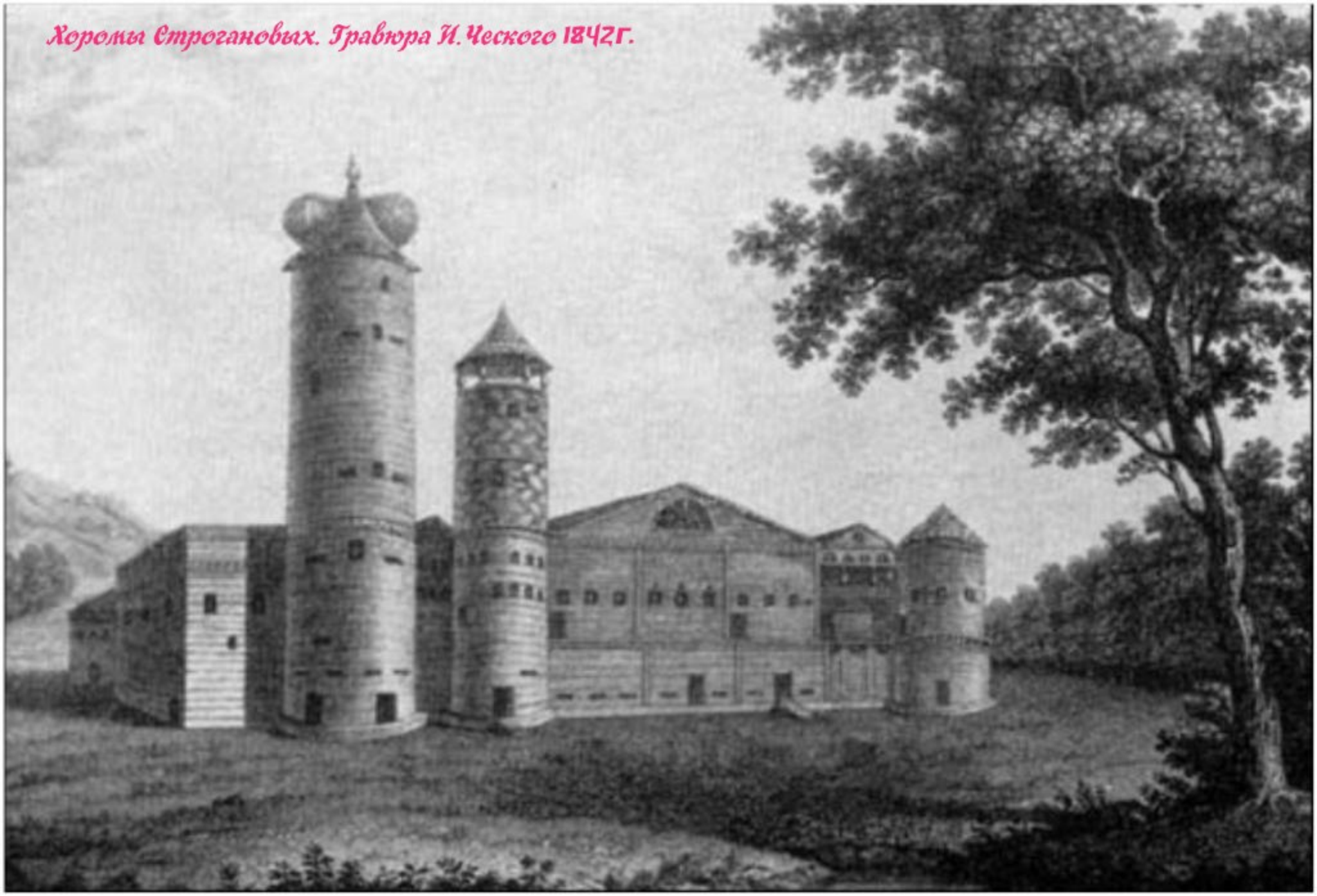
Хоромы Строгановых. Гравюра И. Ческого 1842г.